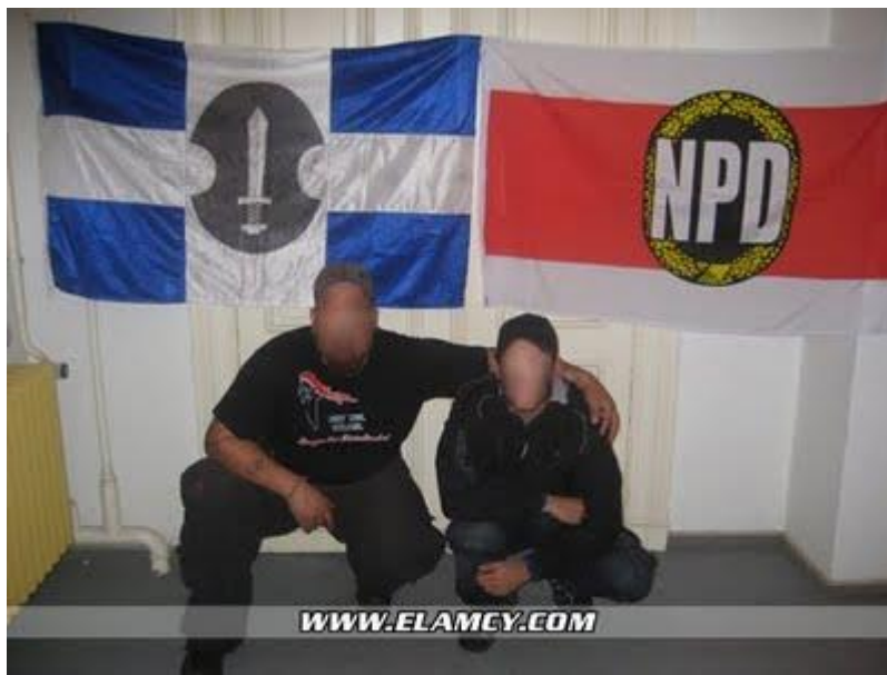
Επίσημη συνάντηση ΕΛΑΜ με το Γερμανικό νέο-νεοναζιστικό κόμμα NDP.